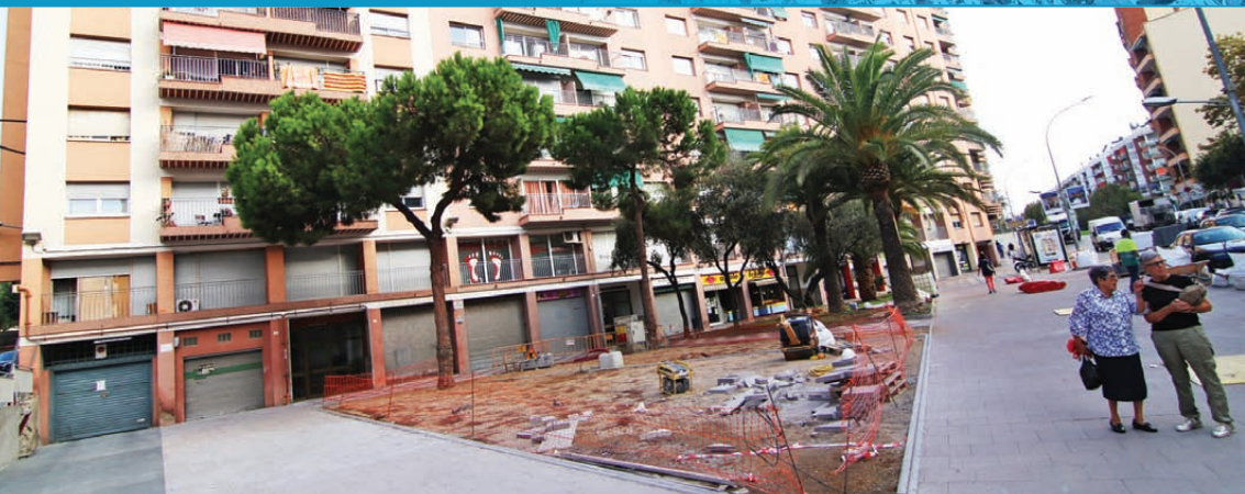
L'estat de les obres a la plaça que s'alçarà a Can Civit